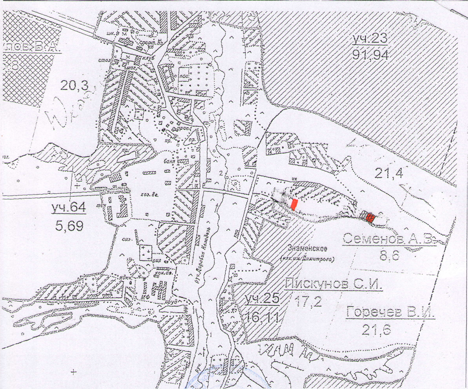
Схема расположения земельного участка