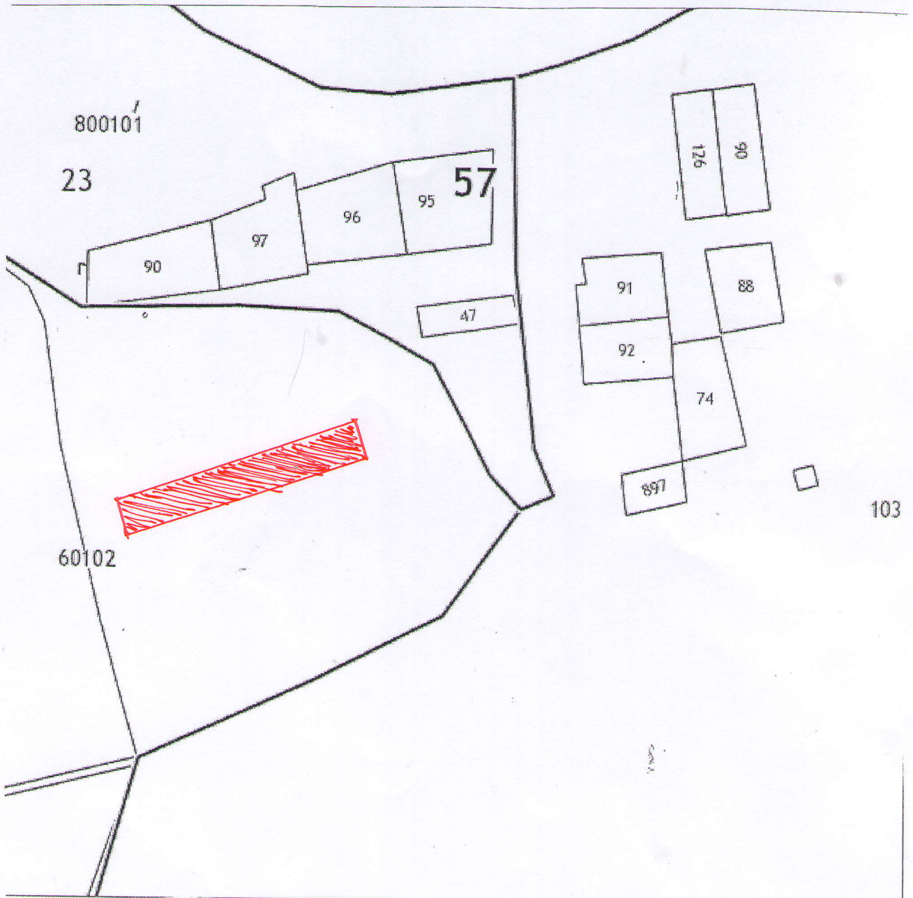
Схема расположения земельного участка